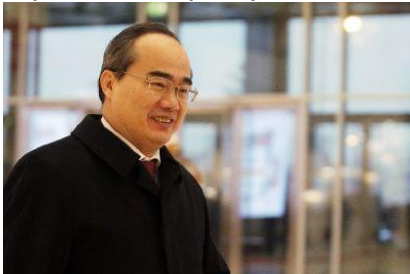
Hình minh họa. Bí thư Thành ủy TP Hồ Chí Minh Nguyễn Thiện Nhân đến Đại hội Đảng ở Hà Nội hôm 28/1/2016.

Thông tin này lập tức nhận được nhiều ý kiến trái chiều lúc bấy giờ, đặc biệt khi việc đền bù đất đai cho người dân bị giải tỏa chưa được giải quyết thỏa đáng, kéo dài trong hàng chục năm qua.