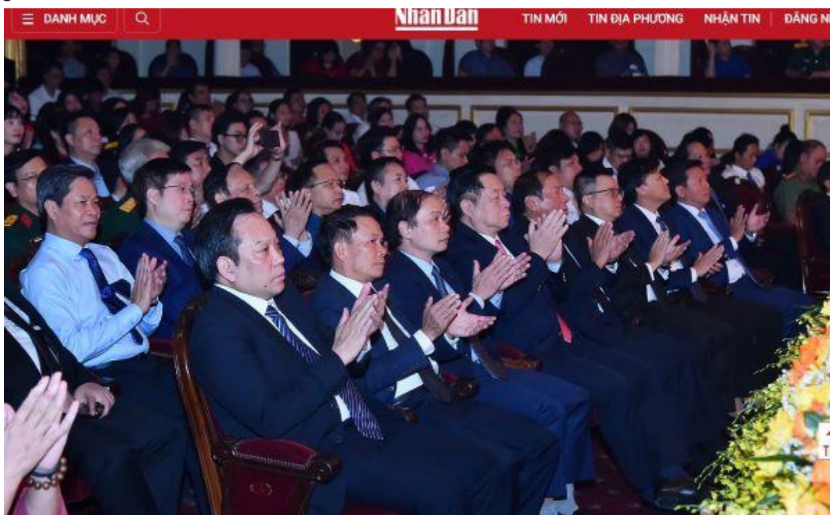
Ảnh chụp màn hình báo Nhân Dân

Nói ngay là tôi đã không định biên gì về những liên quan tới Bộ Văn hóa – Thể thao – Du lịch, bởi chuyện nhà chuyện đời với tôi bấy lâu đủ nhức đầu rồi, nhét thêm nữa thì vỡ mắt. Tập thể hoặc cá nhân, ai chả có lúc sai. Ấy, cứ tặc lưỡi mềm lòng châm chước kiểu vậy.