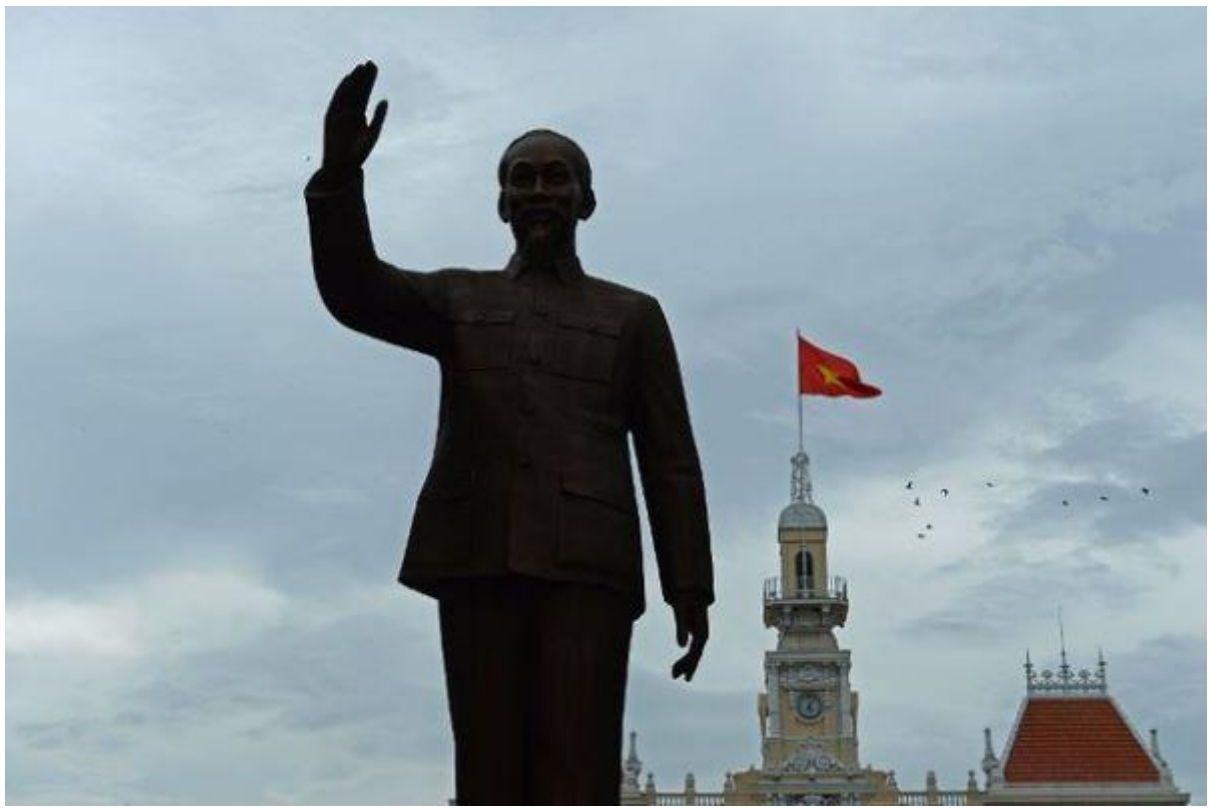
Hình minh họa. Tượng Hồ Chí Minh trước văn phòng UBND thành phố Hồ Chí Minh hôm 23/5/2016.

Báo mạng Zing vào ngày 15/10 đăng tải bài phỏng vấn ông Nguyễn Thiện Nhân, Ủy viên Bộ Chính trị, Bí thư Thành ủy thành phố Hồ Chí Minh, cho biết sẽ lấy niềm vinh dự của địa phương duy nhất được mang tên Hồ Chí Minh thành động lực phát triển, xây dựng không gian văn hóa Hồ Chí Minh.